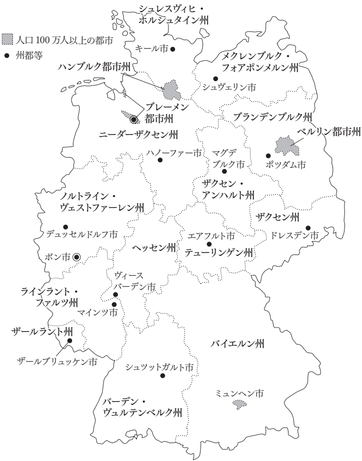
図1 ドイツ各州

保守と環境というテーマで参考になるのが、バーデン・ヴュルテンベルク州緑の党の躍進である。同州では二〇一一年の選挙においてドイツではじめて緑の党から州首相を選出することになった。「保守の牙城」