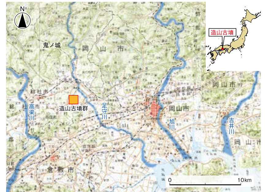
図4・造山古墳の位置

遺跡の宝庫、足守川流域 造山古墳群は、足守川の西岸、北と西に三須丘陵、東は黒住丘陵にはさまれた谷の中央に突き出した標高一〇〇〜四〇メートルの低丘陵上に立地する(図51参照)。造山古墳にかぎらず吉備の古墳は丘陵を利用して 四古墳と千足古墳(第五古墳)は帆立貝形古墳、第二古墳は方墳、榊山古墳(第一古墳)・第三古墳・第六古墳は円墳とされる。ただし、墳形が確定しているのは造山古墳と千足古墳のみで、ほかは今後の調査によって規模や墳形が変わるかもしれない。帆立貝形古墳とは前方後円墳のなかで前方部が短く、上からみるとホタテ貝のように見える古墳のことである。前方部を短くするのは、前方後円墳の築造を許されず、規制を受けた結果という見方がある。