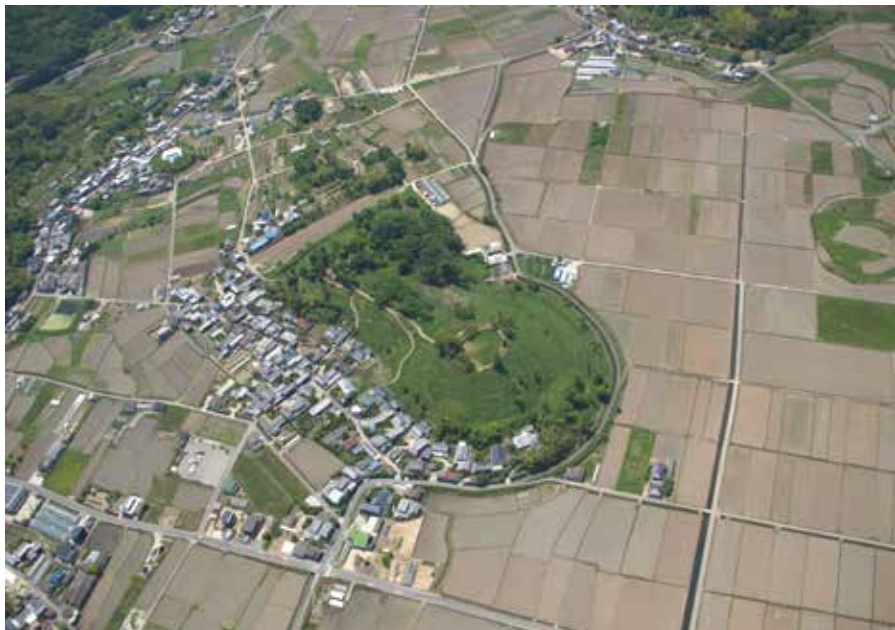
図1・造山古墳空撮（東から） 前方部前端にみえる谷は、尾根を切断した痕跡。後円部は直径206m、高さ29.7mで、前方部は前端216m、高さ22.5m。そのむこうに陪塚群が広がる。右端にみえる丸い水田は新庄車塚古墳の跡。