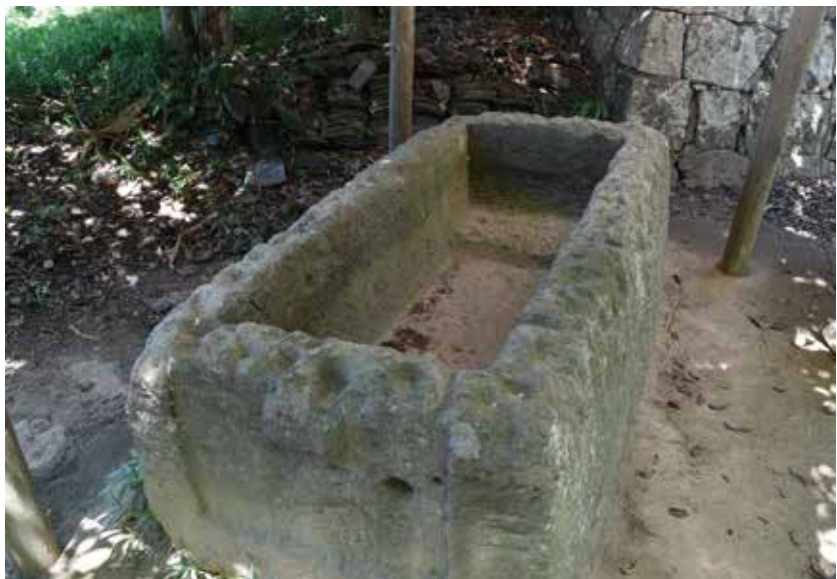
図3 ・前方部の石棺

前方部から南をみると谷をはさんで榊山古墳（第一古墳）がみえる（ 図1・6 ）。その奥には現在整備中の千足古墳（第五古墳）、西（右）に第二古墳がみえる。いずれの墳丘も造山古墳より低位置に築造されているから、造山古墳は千足古墳たちをしたがえた感覚になる。榊山古墳がのる丘陵と造山古墳はかつて一続きの尾根だったことが、測量図をみるとわかる。尾根を人工的に切断し、切り離れた尾根を加工して、